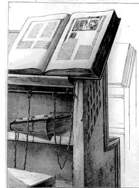
( Sách xích )

..... Sách hay đã nhiều nhưng sách dở cũng lắm như sách đòi trụ khơi dậy dục vọng con người mà cần sự hướng dẫn của học đường và gia đình thanh thiếu niên. Còn có loại sách cấm vì tuyên truyền những lý thuyết vô nhân bản- Công giáo sách cấm hay nguy thư không được phép đọc vì trái với luân lý và đức tin Kytô giáo.