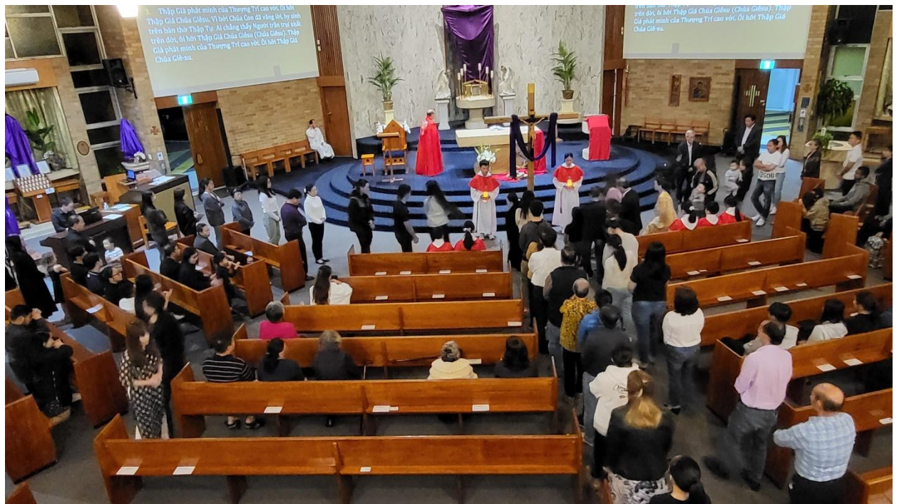
Giáo dân Giáo đoàn Anrê Phú Yên lần lượt lên theo ba hướng để thờ lạy Thập Tự Giá. (ĐN)

Do vẫn còn đang trong thời gian quy định về y tế do dịch Covid nên mọi người không hôn Thập Tự Giá như vẫn thường làm trước đây, mọi người chỉ lên bái gối trước Thập Tự Giá.