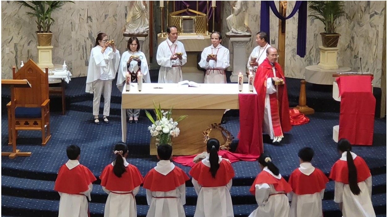
Thừa Tác Viên nhận Minh Thánh từ Linh mục Chủ tế trao để cho giáo dân Rước lễ. (ĐN)