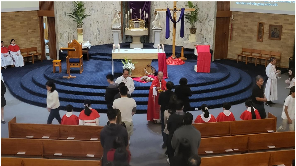
Linh mục Chủ tế và Thừa Tác Viên Thánh Thể cho Giáo dân rước lễ(ĐN)

Sau lời nguyện chúc lành kết thúc, tất cả Giáo dân ra về trong sự im lặng, bầu trời đổ mưa, vừa như để chia sẻ sâu khổ đau thương chia ly của ngày Thứ Sáu Tuần Thánh, và rồi lại như tưới mưa hồng ân của Tình Yêu Thập Tự mà Chúa dành cho chúng con như bài giảng của Cha Chủ tế.