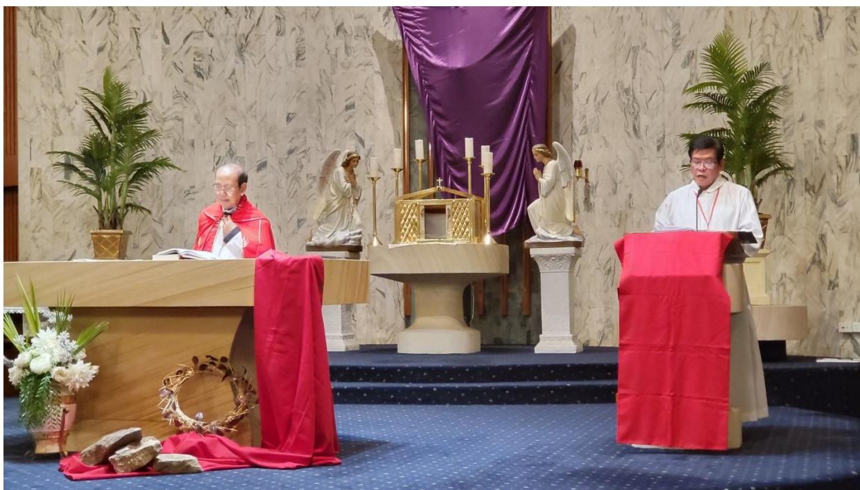
Thừa tác viên dâng lên những lời cầu nguyện trọng thể. (ĐN)