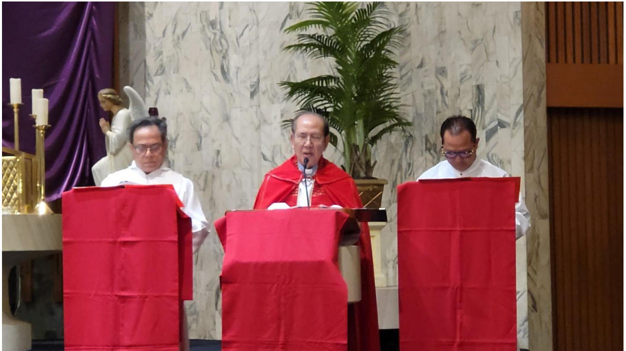
Cha Chủ tế với vở Bi Hùng Sử “Sự Thương Khó Chúa Giêsu”, Trích Thánh Gioan. (ĐN)

Sau bài đọc II, Cộng đoàn cùng tham dự Bi Hùng Sử “Sự Thương Khó Chúa Giêsu” trích Tin Mừng Thánh Gioan.