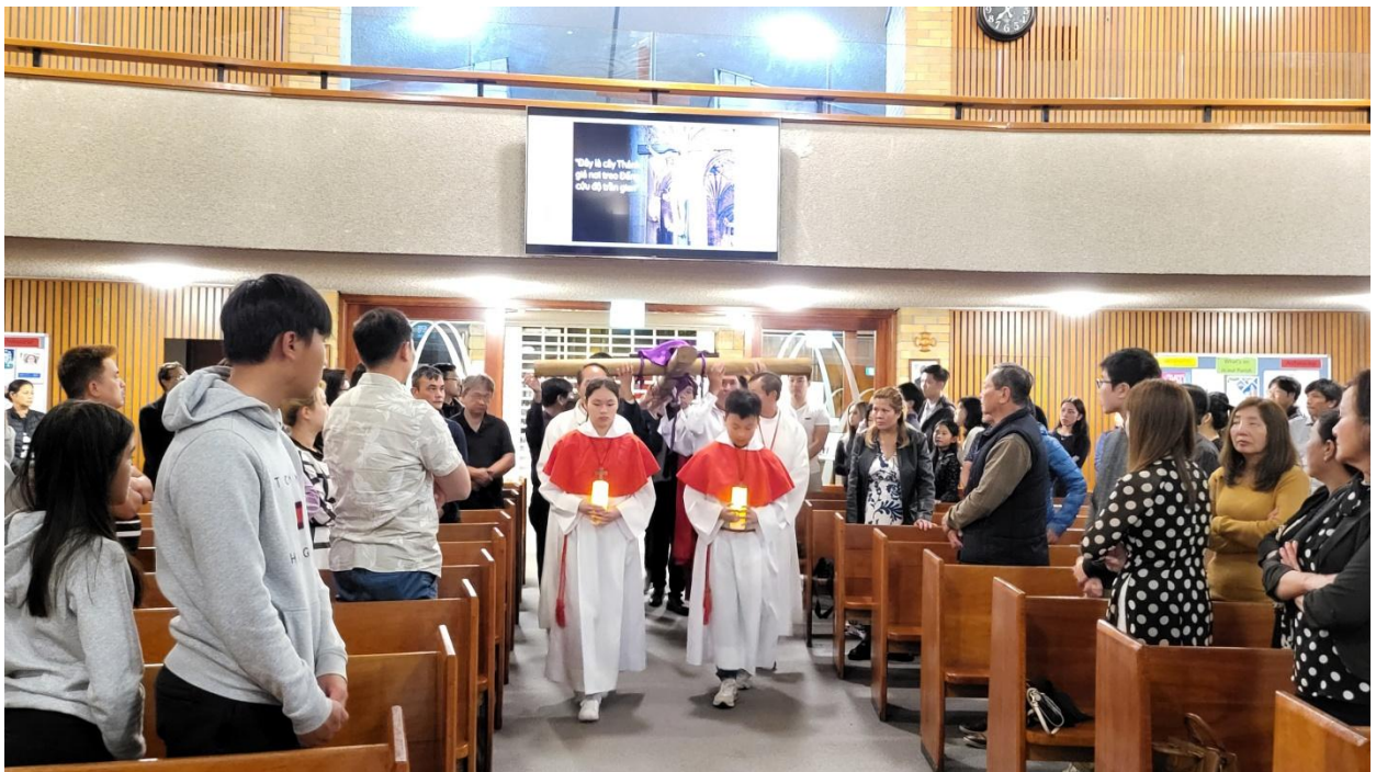
Thập Giá đang tiến đến chặng dừng thứ hai. (ĐN)