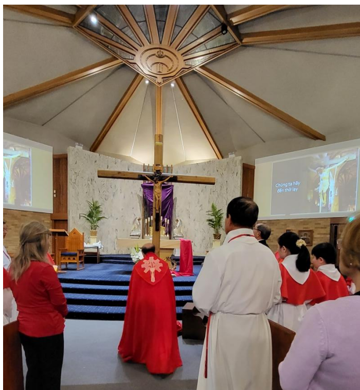
Thập Giá đã được dựng cao trước bàn thờ, Linh mục Chủ tế thờ lạy Thập Giá. (ĐN)