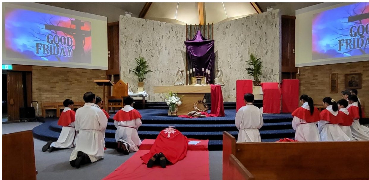
Bàn thờ trống trần trụi, Linh mục chủ tế phủ phục tưởng nhớ cái chết của Chúa Kitô. (ĐN)