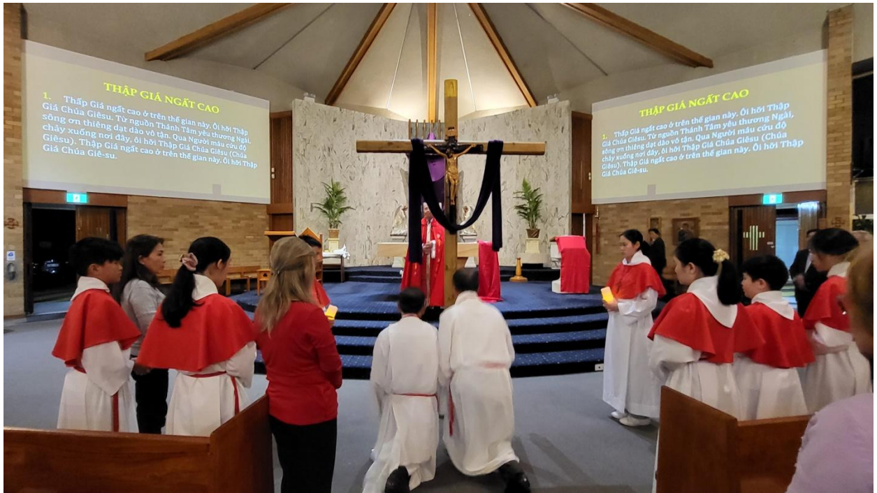
Thừa Tác Viên Thánh Thể thờ lạy Thập Giá. (ĐN)