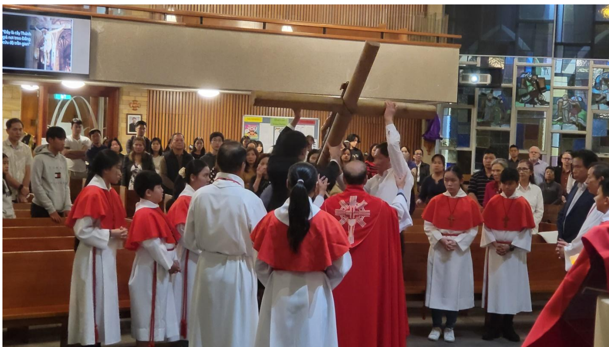
Thập Giá được nâng cao để giáo dân cùng thờ lạy lần thứ ba. (ĐN)