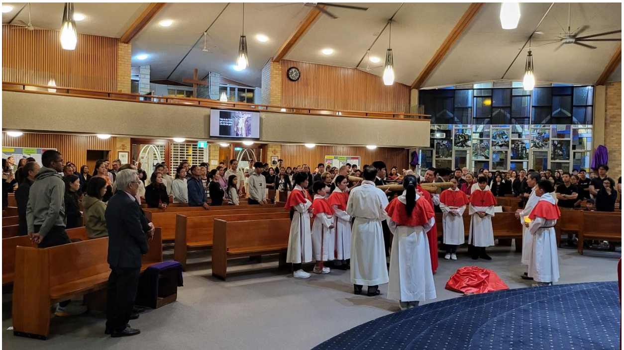
Thập Giá đã đến chặng dừng thứ ba. (ĐN)