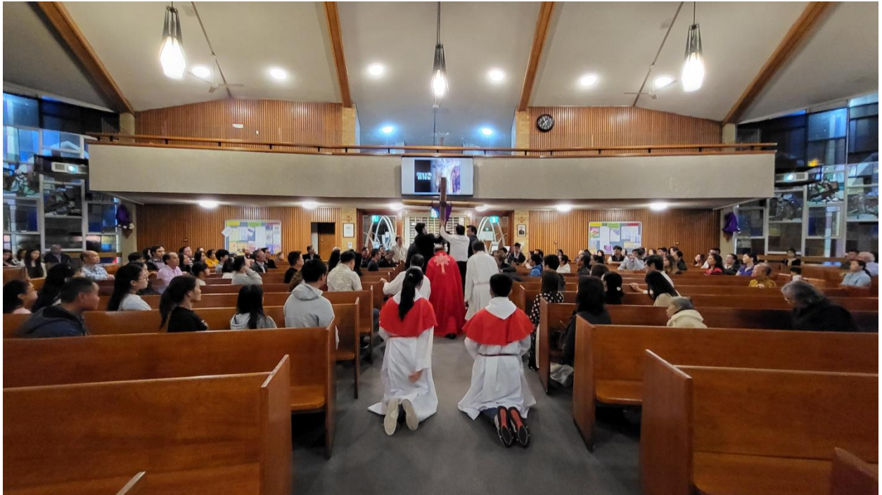
Thập Giá được nâng cao ở lần thứ nhất, tất cả mọi người quỳ xuống để thờ lạy Thánh Giá. (ĐN)