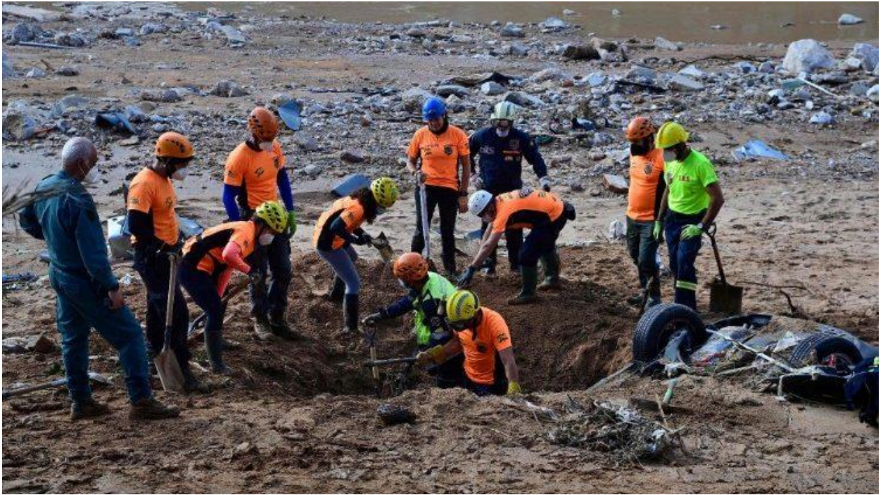
Lính cứu hỏa Tây Ban Nha đào xác một chiếc ô tô để tìm kiếm các nạn nhân bị chôn vùi trên một con sông ở khu vực Valencia