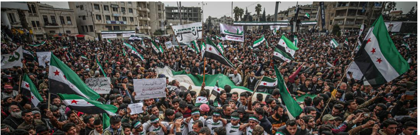
Cuộc nổi dậy của dân chúng Syria

"Đây là hy vọng của chúng tôi", vị tu sĩ dòng Phanxicô người Syria nói, "nhưng chúng ta sẽ phải xem mọi việc diễn ra như thế nào".