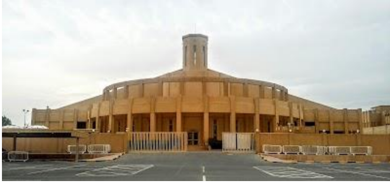
Nhà thờ Đức Mẹ Mân Côi bên ngoài