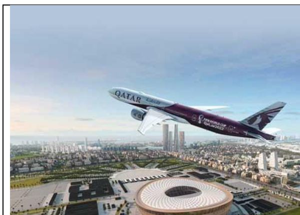
Sân bay Qatar

Qatar là quốc gia có sân bay tân kỳ lộng lẫy nhất thế giới đó là sân bay Hamad nằm ở Doha, diện tích 21km 2 được xây vào năm 2014 với số tiền khổng lồ lên tới 16 tỷ đô la. Sân bay Qatar được xem là một khu tổng hợp đất đỏ, với không gian rộng lớn, thiết kế sang trọng hiện đại khiến bạn choáng ngợp khi đặt chân tới đây.