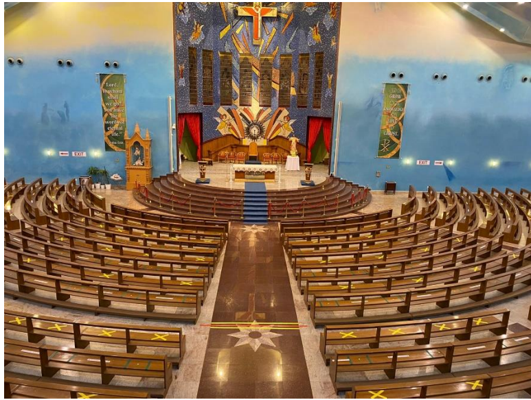
Nhà thờ Đức Mẹ Mân Côi bên trong