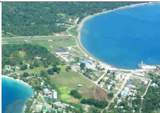
Thị trấn xa xôi Vanimo trên bờ biển trong xanh thơ mộng

Quốc gia này là nơi sinh sống của một số bộ lạc chưa được tiếp xúc trên thế giới, nằm ngay trên một trong những mảng kiến tạo của hành tinh, và động đất và lở đất gần như là chuyện thường ngày, trong khi tình trạng thiếu cơ sở hạ tầng ở những vùng xa xôi có thể gây ra những thách thức nghiêm trọng cho lực lượng cứu hộ và nhân viên y tế nếu thảm họa xảy ra, và thậm chí cả những du khách thường khám phá đất nước này.