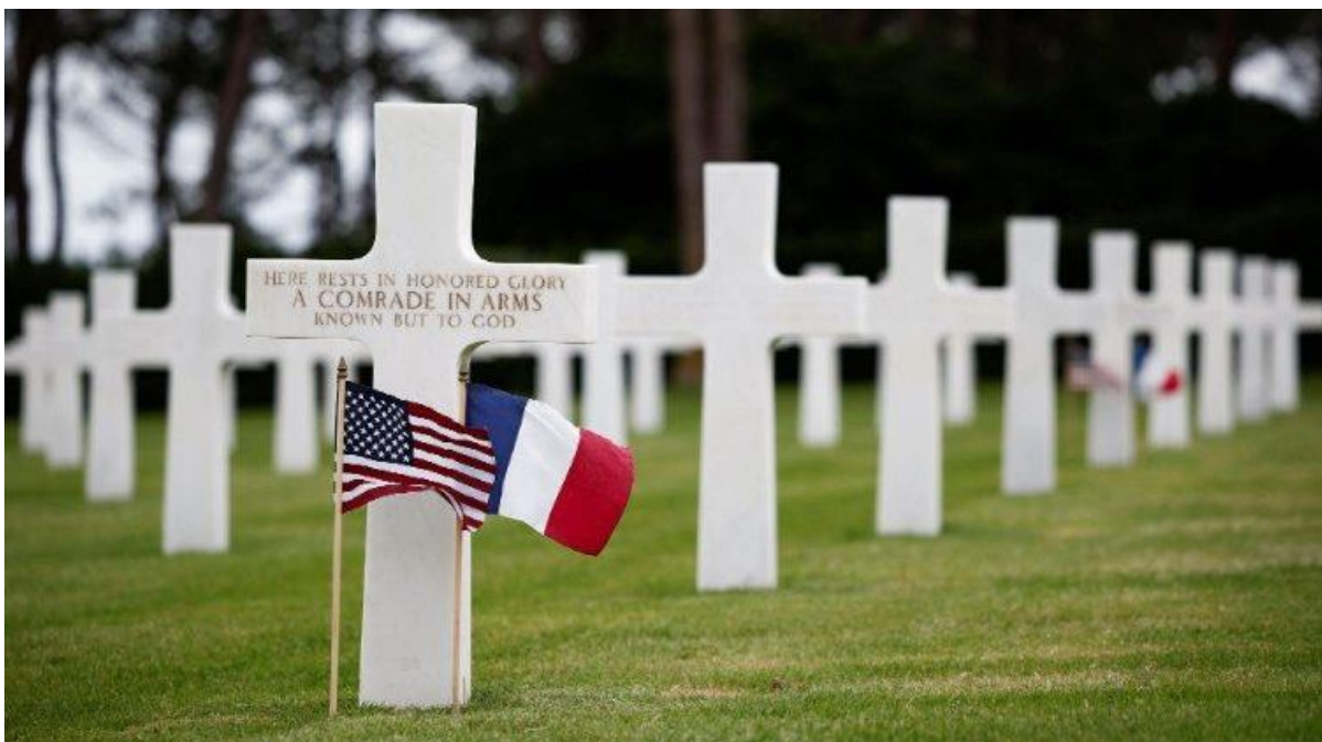
Nghĩa trang và Đài tưởng niệm Hoa Kỳ tại Normandy trong Thế chiến II

Gợi nhớ lại thảm cảnh các thành phố Normandy - Caen, Le Havre, Saint-Lô, Cherbourg, Flers, Rouen, Lisieux, Falaise, Argentan - và nhiều thành phố khác đã bị phá hủy hoàn toàn cùng với mạng sống của vô số nạn nhân vô tội do các vụ đánh bom, Đức Thánh Cha nhấn mạnh tầm quan trọng của việc tưởng nhớ những sự kiện này để lên án và bác bỏ chiến tranh một cách dứt khoát.