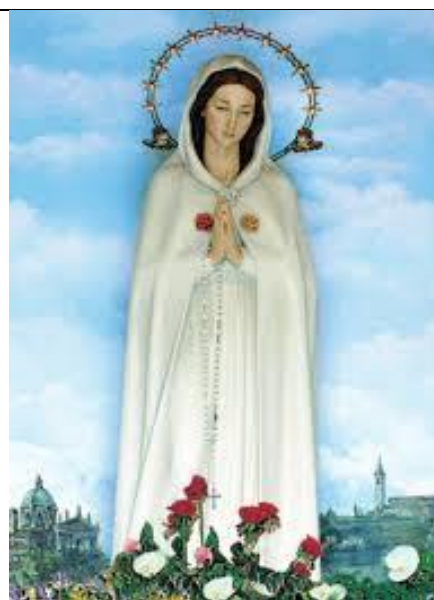
Tượng Mẹ Maria Hoa Hồng