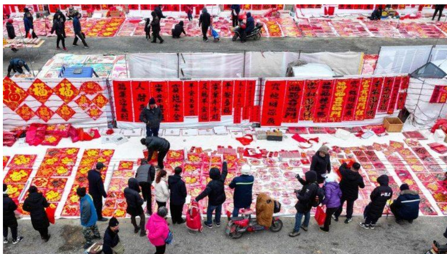
Công tác chuẩn bị đón Tết Nguyên đán ở miền Đông Trung Quốc

ĐTC nói: “Tôi gửi đến anh chị em lời chào thân ái, với hy vọng rằng ngày lễ này có thể là cơ hội để trải nghiệm những mối quan tâm thân thiết và những chăm sóc, góp phần tạo nên một xã hội đoàn kết và huynh đệ, trong đó phẩm giá bất khả của con người được tôn trọng và được chào đón trong cuộc sống.”