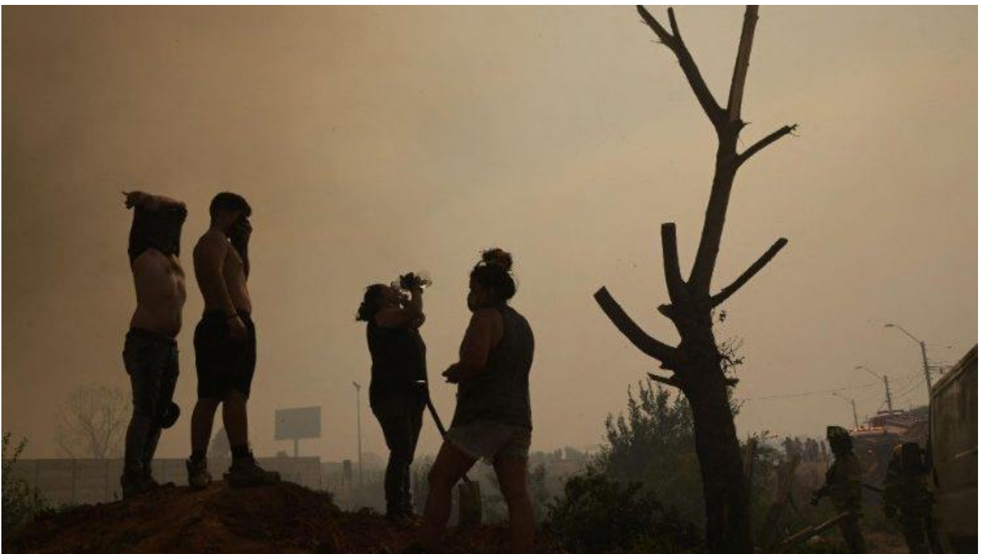
Người dân ở Quilpe, Chile giúp lính cứu hỏa chữa cháy rừng

Khoảng 92 đám cháy đang bùng phát ở nhiều nơi trên đất nước và cho đến nay đã ảnh hưởng đến khoảng 43.000 mẫu rừng.