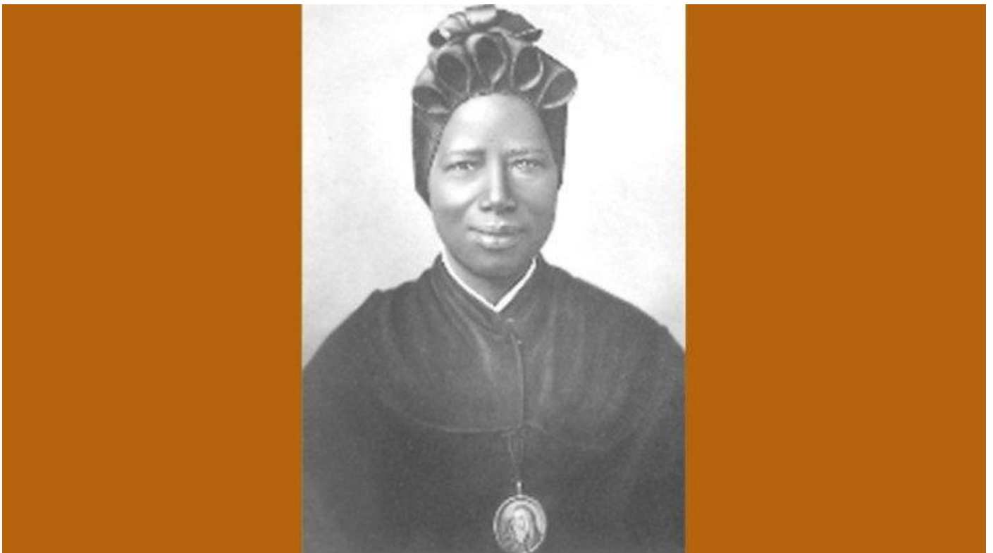
Thánh nữ Josephine Bakhita

ĐTC nói: “Ngay cả ngày nay, nhiều anh chị em vẫn bị lừa dối bằng những lời hứa hảo huyền và sau đó bị bóc lột và lạm dụng. Tất cả chúng ta hãy cùng nhau chống lại hiện tượng buôn người toàn cầu!”