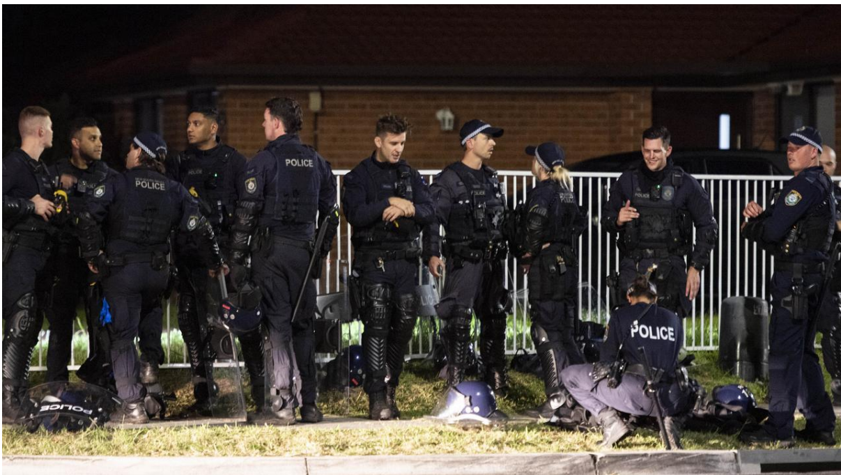
Cảnh sát cố gắng vẫn hồi trật tự...

Cảnh sát cũng cho hay 4 người bị đâm khác không có nguy cơ đến tính mạng.