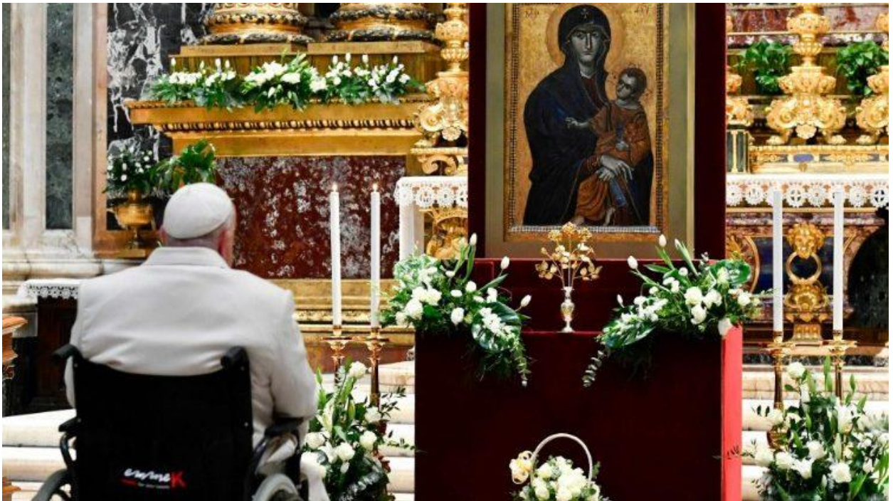
Đức Giáo hoàng Phanxicô cầu nguyện trước hình ảnh Đức Mẹ, Salus Populi Romani, ngày 8 tháng 12 năm 2023

Đức Phanxicô lưu ý rằng những người có mặt trong lễ hôm thứ Hai đã tạo thành một “đội tiên phong” đi trước nhiều người hành hương sẽ về Rome để tham dự Năm Thánh, để cầu xin Đức Maria chuyển cầu cho dân thành Rome và cho toàn thế giới. Theo một cách đặc biệt, những người hành hương cầu xin Đức Mẹ ban cho món quà hòa bình đích thực, món quà chỉ có thể đến từ “những trái tim biết ăn năn và được tha thứ, sự bình an đến từ Thập giá của Chúa Kitô, và từ Máu của Người, mà Người đã nhận từ Đức Mẹ và đổ ra để tha thứ tội lỗi nhân gian”.