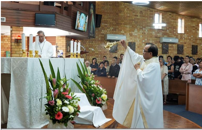
Cha Chủ tế xông hương Bàn thờ