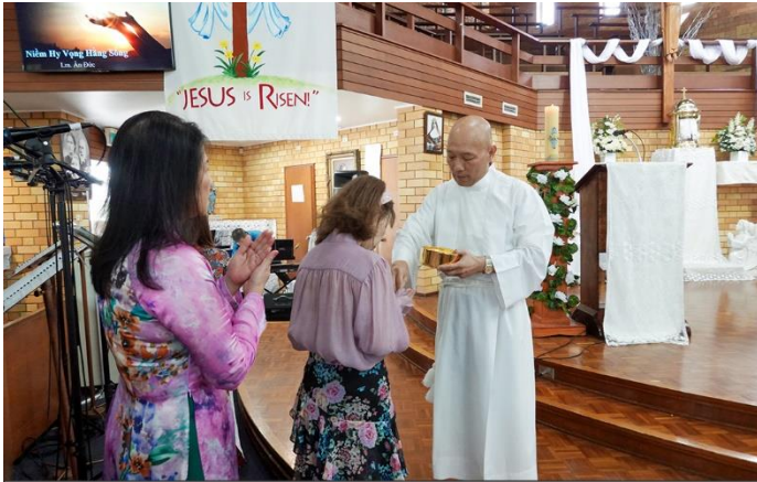
Cộng đoàn đón nhận Mình Thánh Chúa