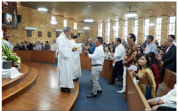
Giáo dân đón nhận Mình Thánh Chúa