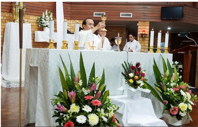
Chúng con hãy làm việc này để nhớ đến Thầy