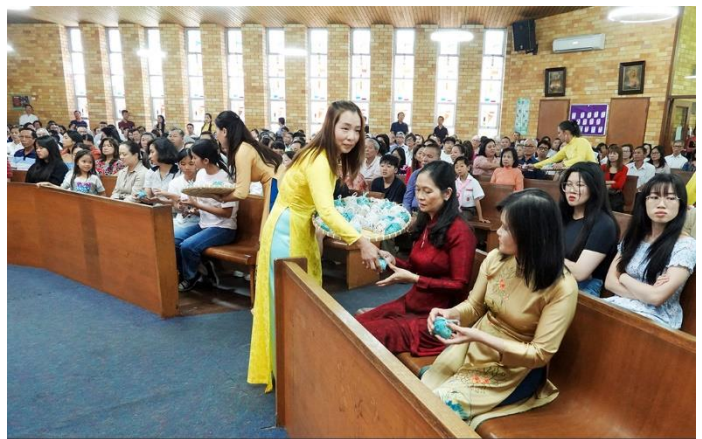
Tặng quà Phục Sinh cho cộng đoàn