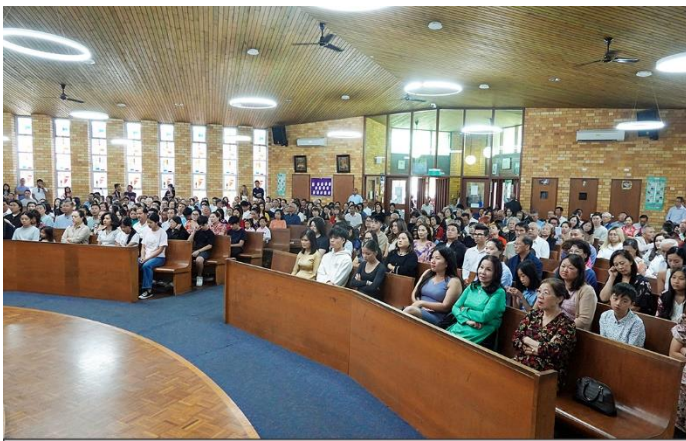
Cộng đoàn Miller lắng nghe chia sẻ Lời Chúa