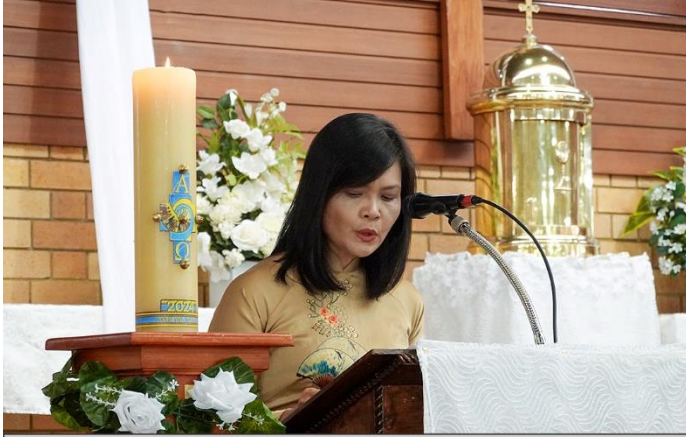
Bài Đọc 2 (Cl 3, 1-4)