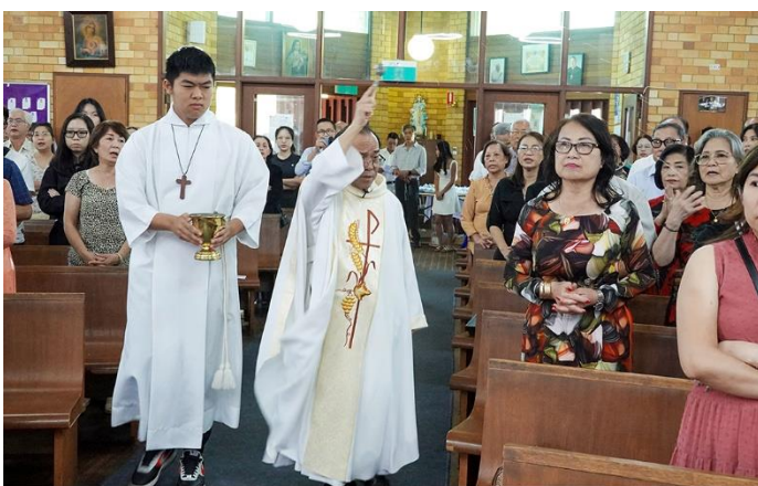
Cha Chủ tế rảy Nước Thánh