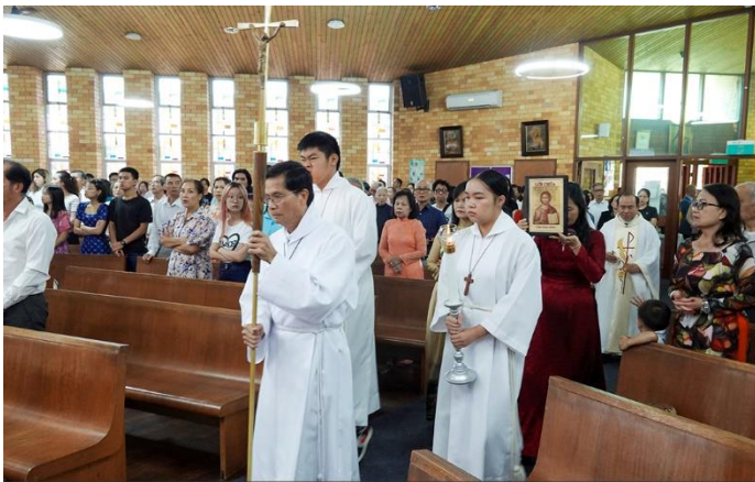
Rước Chủ tế và đoàn Phụng vụ