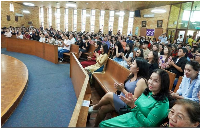
Cùng chúc mừng nhau Niềm Vui Phục Sinh