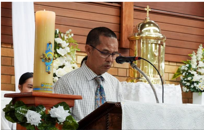
Lời Nguyễn Giáo dân