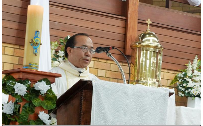
Công bố Tin Mừng Phục Sinh (Jn 20, 1-9)