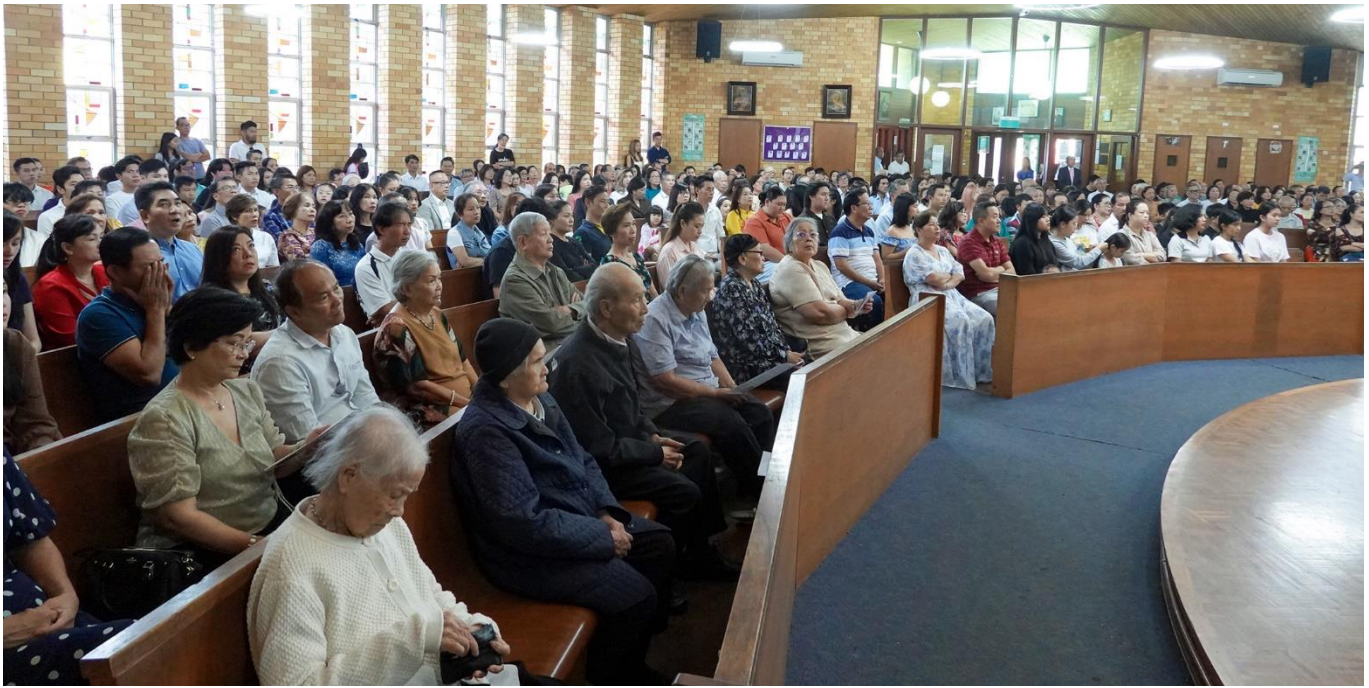
Đông đảo giáo dân Giáo đoàn Fatima Miller tham dự Đại Lễ Phục Sinh