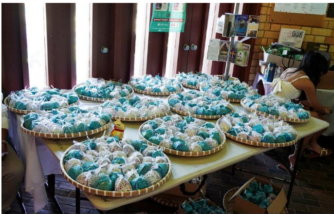
Giáo đoàn chuẩn bị quà tặng Phục Sinh