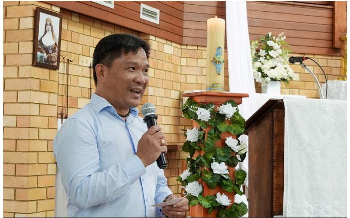
Ông Trưởng ban Mục vụ chúc mừng Phục Sinh