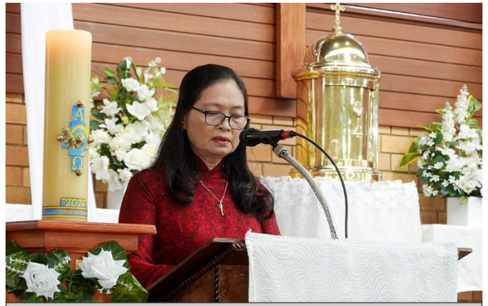
Bài Đọc 1 (Cv 10, 34a. 37-43)