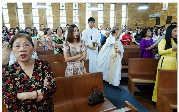
"Tôi đã thấy nước từ bên phải Đền thờ chảy ra."