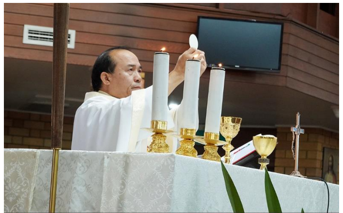
Đây là Mình Thầy. Các con hãy cầm lấy mà ăn.