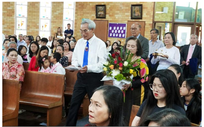
Dâng Lễ vật