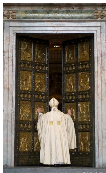
ĐTC mở cửa Năm Thánh ở Vương cung thánh đường Thánh Phêrô

Mỗi vương cung thánh đường trong số bốn vương cung thánh đường lớn ở La-Mã là: Đền Thánh Phêrô, Đền thờ Thánh John Lateran, Đền thờ Đức Bà Cả, và Đền Thánh Phaolô Ngoại Thành – mỗi nơi đều có một “Cửa Thánh”, biểu tượng tuyệt vời cho Năm Thánh. Nó tượng trưng cho Chúa Giêsu, Đấng đã tuyên bố trong Tin Mừng: “Ta là cửa. Ai qua Ta mà vào thì sẽ được cứu độ.”