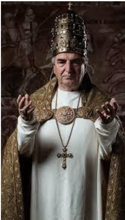
Đức Boniface VIII