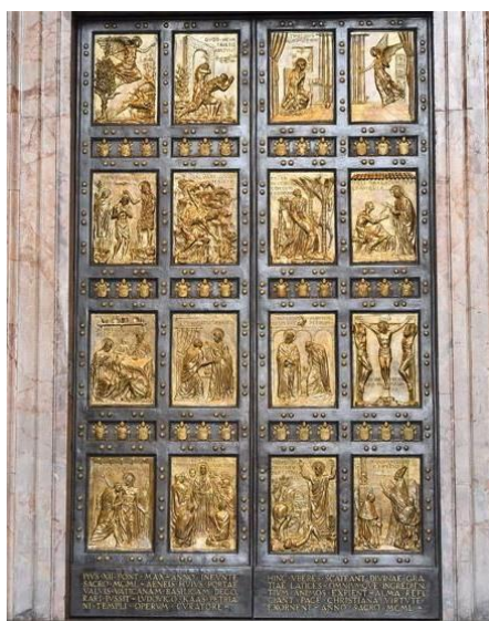
Cửa Năm Thánh của Vương cung thánh đường Thánh Phêrô