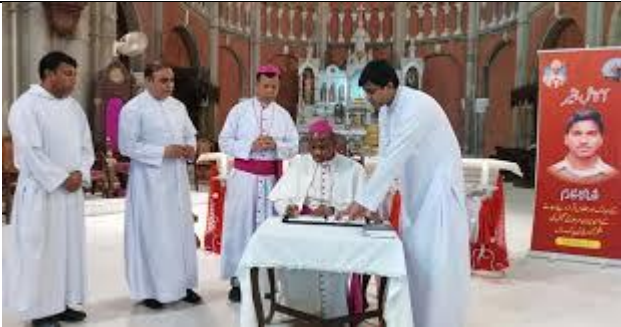
Hoàn tất tiến trình cấp Giáo phận

biết sâu sắc và tình bạn với Chúa Kitô. Tôi tớ Chúa thường dừng lại đôi giây lát để cầu nguyện trước hang đá trong sân của Nhà thờ thánh John ở Youhanabad, trước khi bắt đầu ngày học của mình. Ba nguyên tắc cơ bản của linh đạo Salêdiêng – hệ thống phòng ngừa, giáo dục toàn diện và tình yêu dành cho Thiên Chúa – đã ảnh hưởng sâu xa đến sự phát triển đức tin của Tôi tớ Chúa, chúng là những cột trụ cột quan trọng trong việc định đoạt hành trình đường đời của Tôi tớ Chúa”.